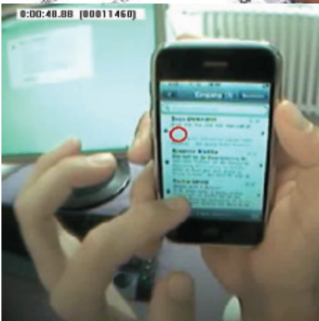
Analogie gewinnt! Eine Bedienbarkeit von Mobiltelefonen, die sich am natürlichen menschlichen Verhalten orientiert, ist im Vorteil.