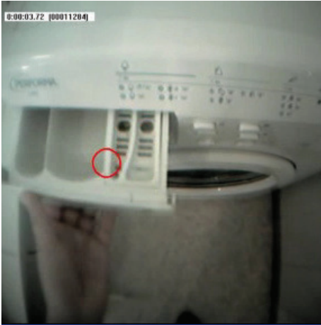
Produkt Usability Test einer Waschmaschine im heimischen Umfeld mit Eye Tracking. Wohin der Kunde blickt, zeigt der rote Kreis.